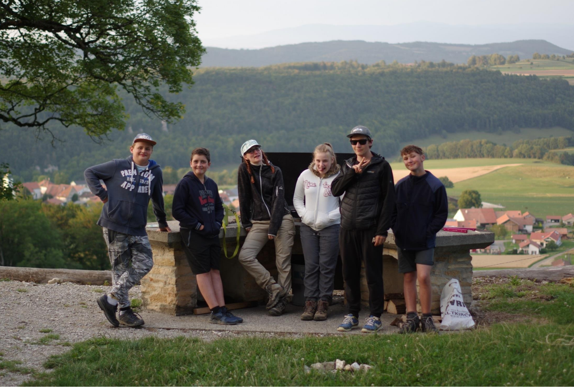
La mixité obligée de faire avec...